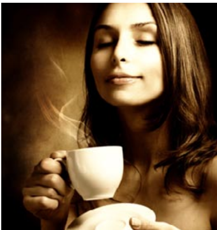
Genuss kann auch eine Tasse Kaffee sein – wichtig ist nur, dass man diesen Moment auch bewusst wahrnimmt.

• Genuss braucht Zeit: Schnelligkeit und Genuss stehen im Widerspruch. Schaffen Sie sich